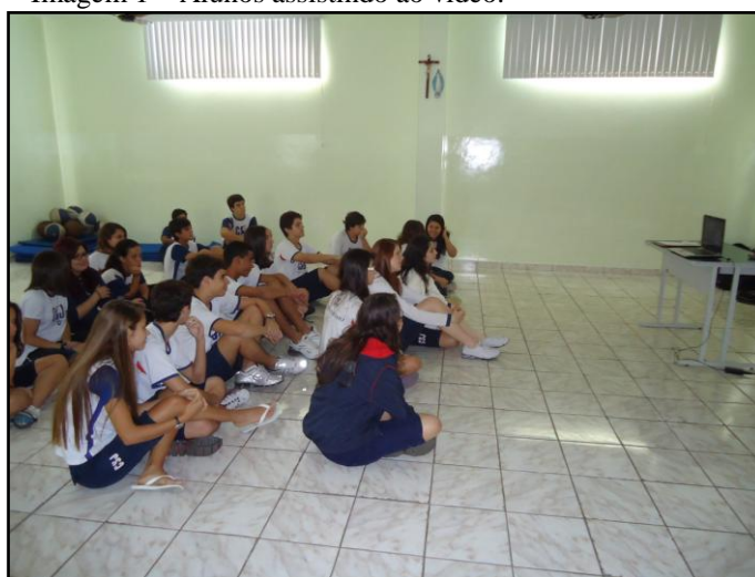
Imagem 1 – Alunos assistindo ao vídeo.

Também direcionamos a aula de modo que os alunos apresentassem seus conhecimentos sobre o assunto, fazendo perguntas ao longo da aula, à medida que íamos aprofundando o conteúdo. Por exemplo, quando exibimos o vídeo sobre os quatro elementos do hip hop , perguntamos aos alunos se tinham conseguido identificá-los. Alguns levantaram o dedo e responderam: “arte” (fazendo uma alusão ao grafite) “dança” (representando o break ), “rima” e “música” (representando o mc e dj ).