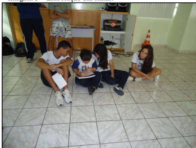
Imagem 4 – Desenho elaborado pelos alunos.