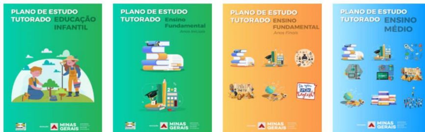
Planos de Estudos Tutorados 2020

A partir do PET 2, a Educação Física começou a integrar os materiais curriculares, sendo inserida nas 6 edições posteriores, sendo organizada da mesma forma que os demais componentes curriculares, com cada edição tendo em médio 4\5 semanas de prescrição de atividades.