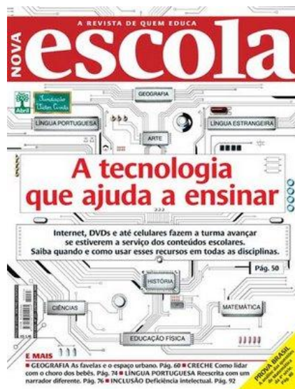
Fig. 1 – Capa da RNE

Atualmente a RNE é editada em São Paulo e tem periodicidade mensal, embora até o ano de 1997 circulou em nove edições anuais e, a partir de 1998, tem circulado em dez edições por ano (nos meses de julho e janeiro não há edição da revista, devido ao período de recesso, que, salvo exceções, ocorre de maneira generalizada em todo Brasil).