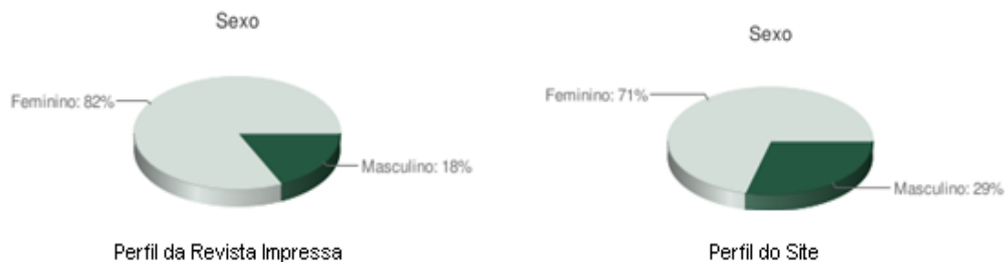
Gráfico 1 – Perfil dos leitores em relação ao sexo

Sobre o perfil dos leitores da RNE 6 , o site da revista informa que a maior parte é do sexo feminino, seja no formato impresso ou no site da revista, conforme dados abaixo: