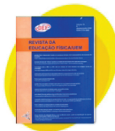
Figura 2 Foto do formato da capa: volume 16, nº 1 (Revista da Educação Física/UEM, 2005).

Este fato elevou a quantidade de artigos recebidos. Em 2007 a revista recebeu cinquenta e quatro (54) artigos para avaliação de publicou vinte e quatro (24) artigos. Muitos desses artigos foram “convites” feitos a pesquisadores e professores dos programas de pós-graduação. Com a maior credibilidade e visibilidade a segunda ação foi de indexar