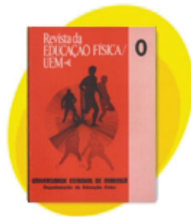
Figura 1 Foto da primeira capa do volume zero do ano 1989 da Revista da Educação Física/UEM.

Sem dúvida que essas decisões foram criticadas por alguns membros da comunidade acadêmica da área, pois entendiam