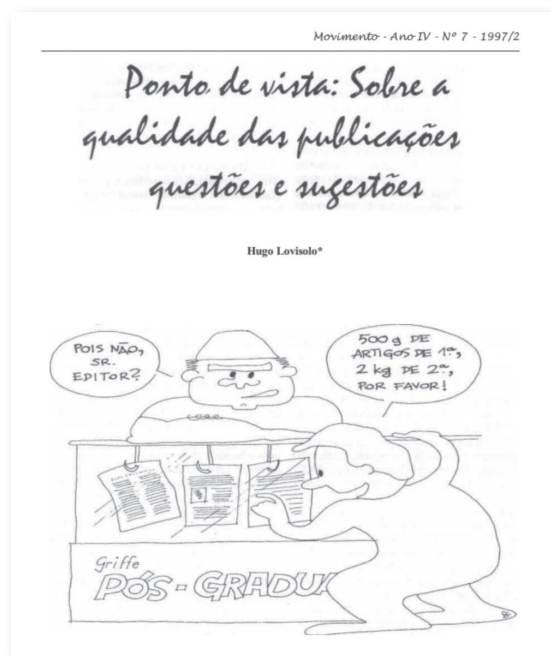
Figura 1 Qualidade das publicações.

laterais, 7 fizeram parte do layout gráfico que visava seduzir um público diversificado para a leitura da revista. Abaixo pode ser visualizado um exemplo do design dos primeiros números da Movimento : trata-se da primeira página de um artigo nela publicado na sua sétima edição, em 1997 (fig. 1).